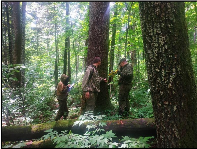
Сотрудники заповедника на полевых работах

Каждая постоянная пробная площадь характеризует один тип леса. Деревья на пробной площади имеют свой уникальный номер, который был присвоен им при закладке участка в далеком 2002 году. Для каждой пробной площади составлена перечетная ведомость, в которую включается информация о видовом составе насаждения, размерах каждого дерева (прежде всего диаметр и высота), протяженности кроны. В настоящее время проводится камеральная обработка собранного материала. Участники работ по переописанию постоянных пробных площадей уверены, что полученные сведения дополняют информацию о развитии растительных сообществ заповедника «Бастак».