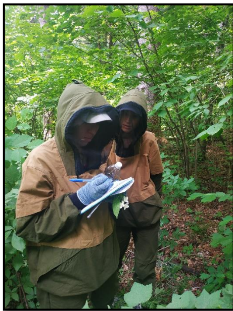
Сотрудники заповедника на полевых работах