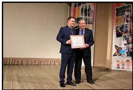
Праздничное мероприятие День Земли