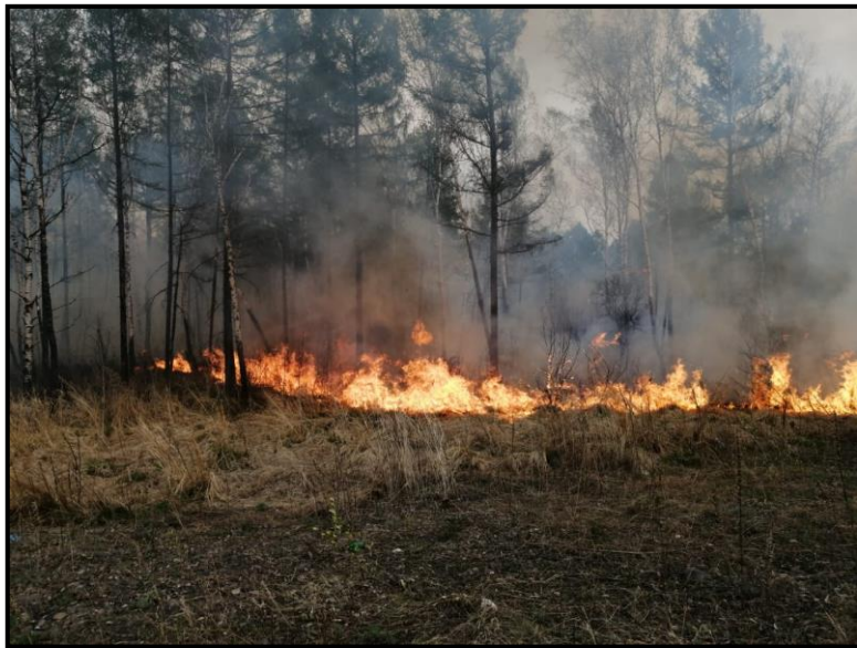
Пожар в лесном массиве

порывами ветра и высокими дневными и ночными температурами воздуха, что способствовало стремительному распространению и не давало в кратчайшие сроки ликвидировать данный пожар.