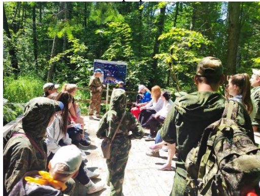
Семьи участников СВО на экскурсии в заповеднике

В День семьи любви и верности гости заповедника насладились общением с Природой и провели полезно время со своими семьями на лоне дикой природы.