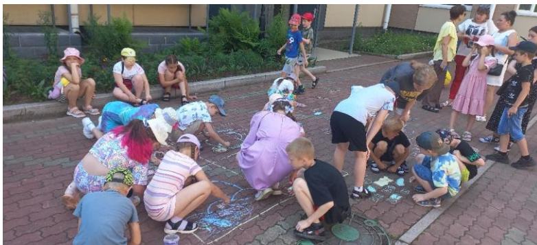
Мероприятие, проводимое сотрудниками отдела экологического просвещения и туризма со школьниками

В летний каникулярный период визит – центр посещают школьники из оздоровительных детских лагерей. В июне 2023 года визит – центр посетило 46 детских групп с численностью более 1200 детей. С данными школьниками проведены кинолектории о заповеднике с показом презентаций, раскрыты особенности животного и растительного мира территории заповедника «Бастак». Все участники мероприятий пополнили копилку знаний новыми интересными фактам из мира заповедной природы «Бастак».