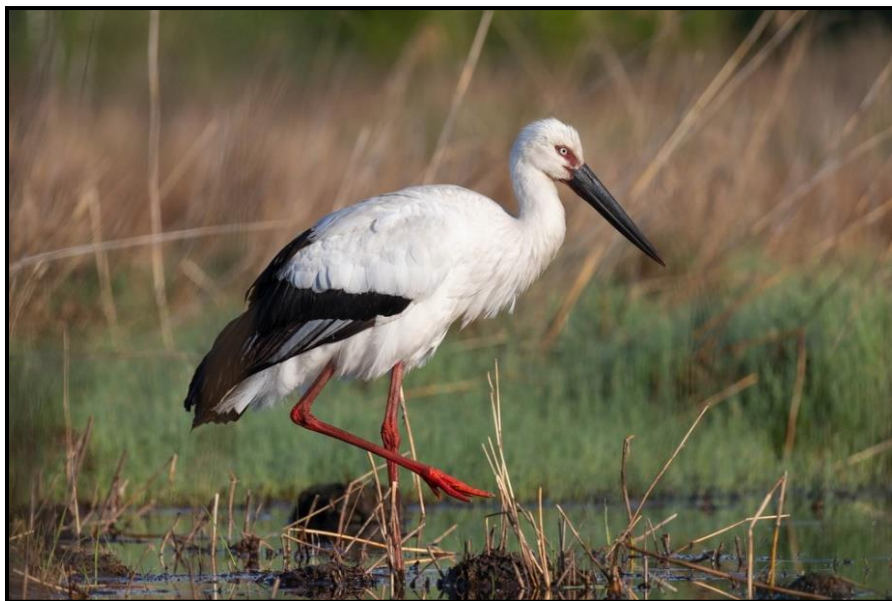
Дальневосточный аист, природный заповедник «Бастак»