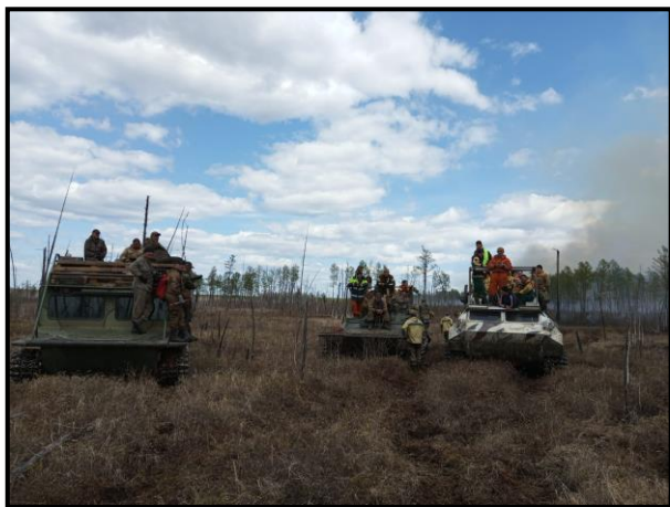
Группа тушения пожаров на территории заповедника

С наступлением весеннего пожароопасного периода 2023 года и сходом снежного покрова постоянно проводилось патрулирование территории заповедника и его охранной зоны. Сотрудниками отдела охраны заповедника, устранены 4 угрозы перехода огня на территорию ООПТ, но ввиду неблагоприятных погодных условий произошел переход огня с соседних территорий на территорию заповедника. Было зарегистрировано в весенний пожароопасный период 2023 года два таких случая.