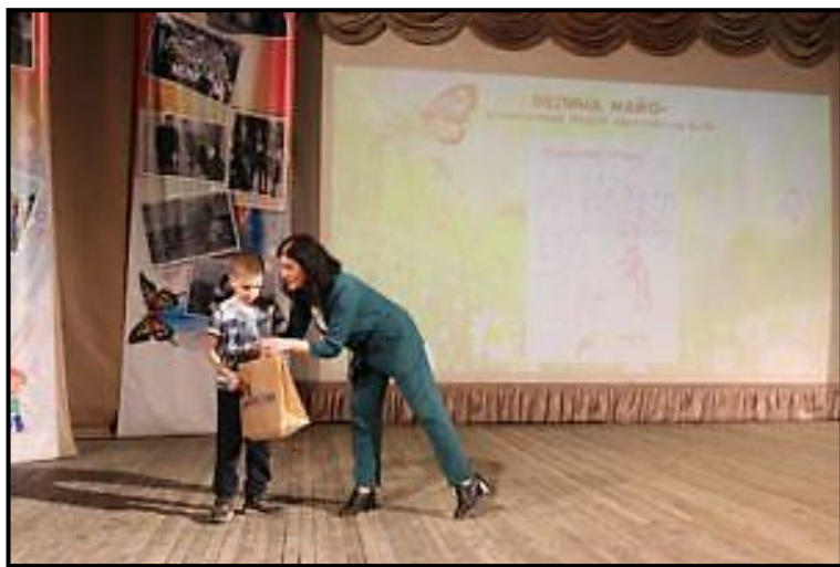
Праздничное мероприятие «День Земли»

Ежегодно по традиции государственный заповедник «Бастак» проводит праздничное мероприятие, посвященное этому дню. В этом году оно состоялось на базе Центра детского творчества. В актовом зале собрались представители правительства области ЕАО, мэрии города, сотрудники природоохранных организаций, школьники и дошкольники, и люди, которые всей душой болеют за сохранность уникальной природы нашего региона.