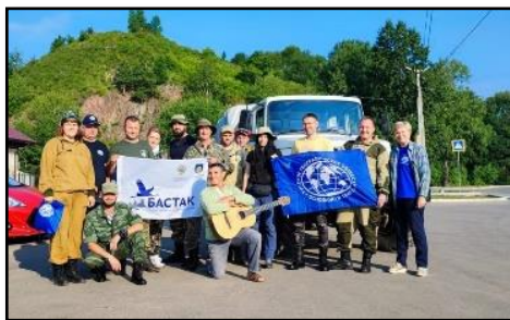
Участники туристического похода

Участники похода отметили живописность ландшафта, через который пролегает туристический маршрут. Отметили уникальность пихтового леса. Впервые участники похода увидели горнотундровую растительность. По мнению участников похода горнотундровые пейзажи будут привлекать туристов для прохождения данного туристического маршрута. Кроме